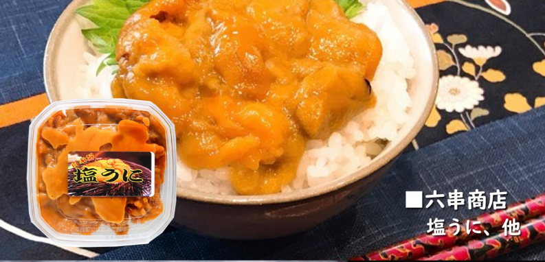
■六串商店 塩うに、他