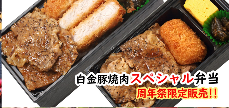
白金豚焼肉スペシャル弁当 周年祭限定販売!!