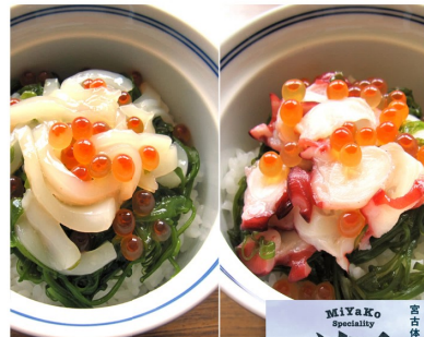
■川秀：瓶ドン (数種類) 食べる、インスタ映え。 お家で「三陸ドン」。