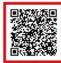
北三陸ファクトリー