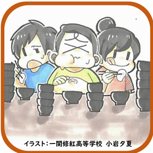
イラスト:一関修紅高等学校 小岩夕夏