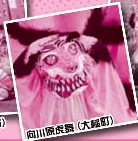
向川原虎舞(大槌町)