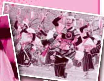
中野七頭舞(岩泉町)