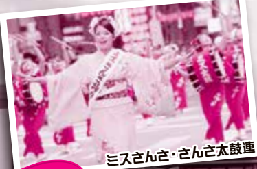
ミスさんさ・さんさ太鼓連