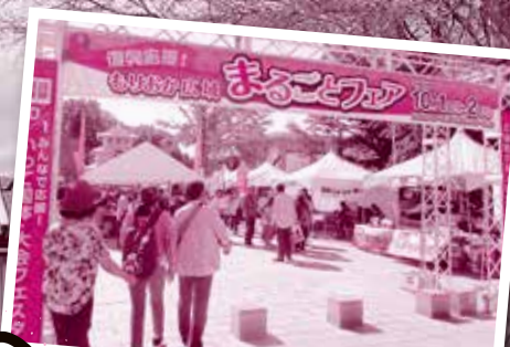
盛岡広域圏の特産品販売と ご当地グルメの販売のほか ステージイベントも満載!