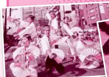
仙台すずめ踊り 伊達の舞(仙台市)

ミスさんさ・さんさ太鼓連(盛岡市)、向川原虎舞(大槌町) 中野七頭舞(岩泉町)、ふだい荒磯太鼓(普代村) ほか県内各地より多数出演 仙台すずめ踊り 伊達の舞(仙台市)の披露も!