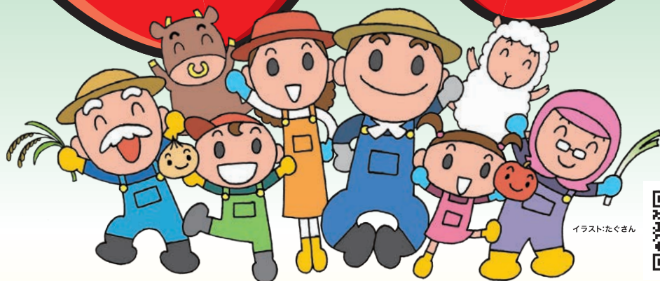
イラスト:たくさん