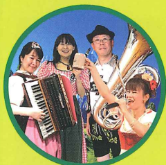
ドイツ民謡の生演奏