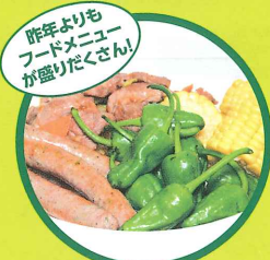
昨年よりもフードメニューが盛りだくさん！