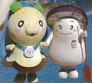
山田町PRキャラクター ヤマダちゃん&たけちゃん