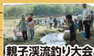
親子溪流釣り大会