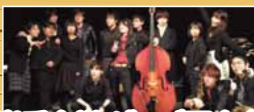
岩手大学ジャズ研究会