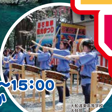
大船渡東高等学校 太鼓部