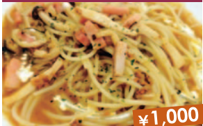
しずくいしトマトスープカレーパスタ