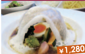
小岩井かまくらスープカレー