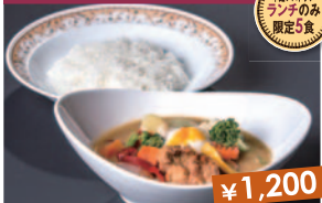
雫石スープカレー