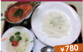
雫石トマトスープカレー