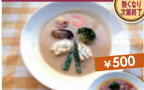
海鮮スープカレーホワイト(サラダ・ライス等付)