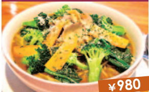
野菜たくさんスープカレーパスタ