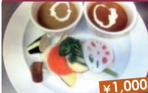
雫石2種スープカレー