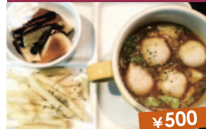
kidsコロコロカレー(ポテト・デザート付)