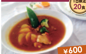
雫石スープカレー