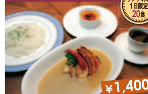
高倉スープチキンカレー