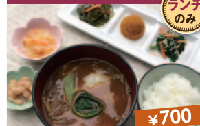
ひつまみ入り和風スープカレー定食