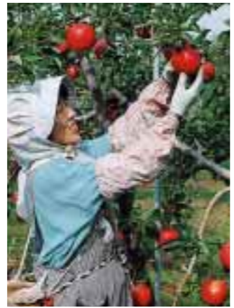
実りの秋、1個1個丹念に収穫します。