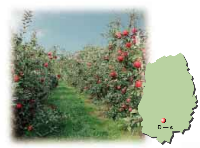
太陽を十分に浴びているりんご